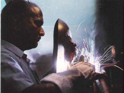
SOUDE A LA MAIN. Dans l'usine Enfield, à Madras, il n'existe aucun poste de soudure automatique. Des ouvriers, véritables artistes de la brasure, assemblent chacun des éléments du cadre de la Bullet 350.