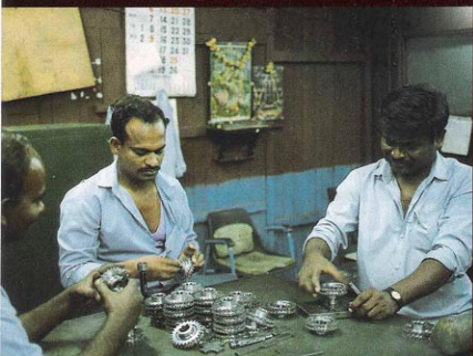
LE COUP D'ŒIL. Les usines japonaises utilisent souvent le laser pour contrôler la qualité de fabrication des pièces. En Inde, ce sont les hommes qui, à l'œil, vérifient chacun des pignons qui constituent la boîte de vitesses des Enfield.