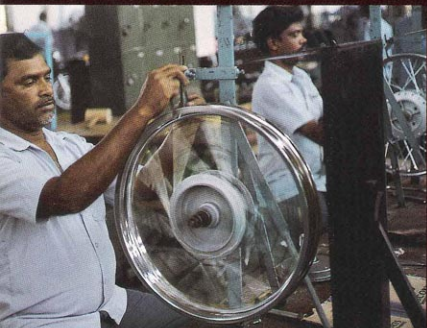
ENFIN DEVOILEES. Chaque année, 40 000 roues, assemblées hors de l'usine, sont livrées à Madras dans des charrettes attelées à des bœufs. Elles sont ensuite rayonnées dans la plus grande tradition artisanale.