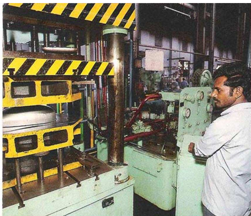
POSTE CONVOITE. Peu à peu, les ateliers se modernisent. Mais les machines-outils sont chères et commander un poste automatique est un privilège. C'est le seul endroit de la chaîne de fabrication où l'huile de coude n'est pas nécessaire.