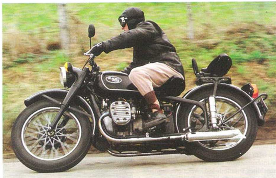
● L'Etoile Noire en pleine attaque. Les pneus carrés prévus pour le side imposent un pilotage un peu spécial, mais finalement on s'y fait.

enfin jouir pleinement des sensations oubliées que nous distillent ces deux chouettes moulbifs.