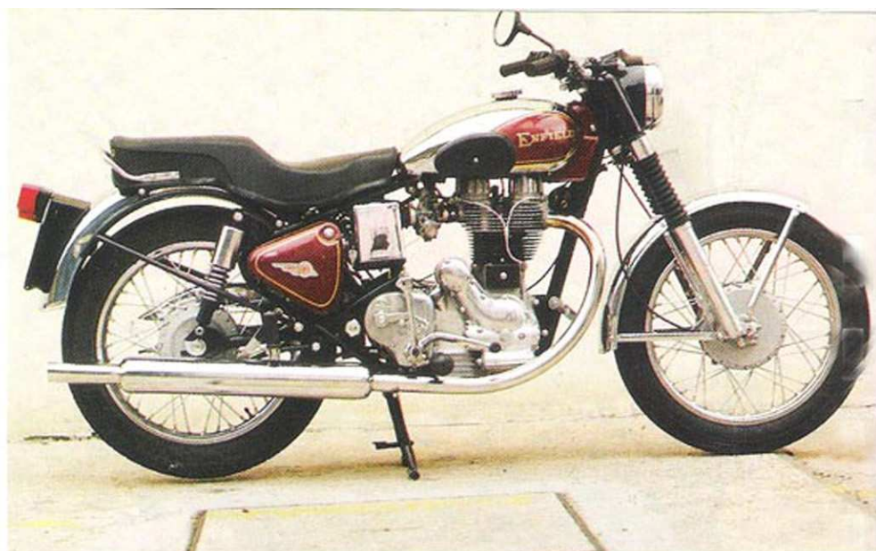
● Toute de finesse et de rondeurs, le superbe réservoir chromé de la 500 apparaît comme la seule différence extérieure avec la 350.

Démarrer ces machines ne pose guère de problème, pour peu que l'on sacrifie au fameux rituel de mise en marche propre aux motos d'hier. Rien de sorcier rassurez-vous. La bête, pardon, la Chang Jiang 750 (Hé oui, va falloir vous y faire), s'ébroue