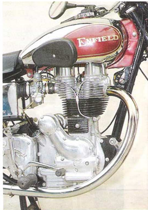
● Ciselé comme une sculpture, le moteur de la Bullet est aussi beau à regarder qu'agréable à utiliser. La longue courbure du tube d'échappement est également un régal pour l'œil.

Avec l'arrivée des petites routes viroleuses, nos machines vont enfin dévoiler pleinement leurs caractères et leurs différences. SHHLAAK! Le petit père Vedel décide d'augmenter le rythme et passe l'Enfield dans un claquement de boîte d'outre-tombe. La longue ligne droite qui file à travers champs est suffisamment bosselée pour se faire une idée déjà très précise sur le confort de nos bécanes. Le gromono ne souffre à ce sujet d'aucune critique particulière, offrant une assise "à l'Anglaise" - guidon assez haut et repose-pieds légèrement avancés - et une douceur de selle tout à fait comparable à ce que nous proposons des