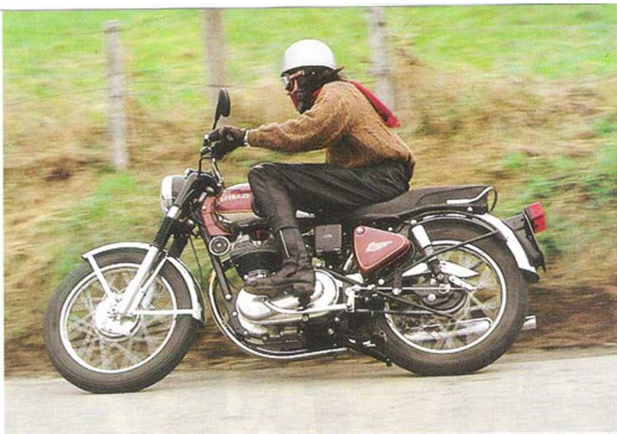
● Vive et légère, animé d'un moteur coupleux à défaut d'être puissant, L'Enfield 500 inciterait presque à l'attaque.