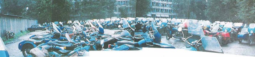
Sur le parking du personnel de l'usine Ural, on ne compte plus les sides. Il y en aurait 20 000 dans la ville d'Irbit, pour une population de 50 000 habitants.