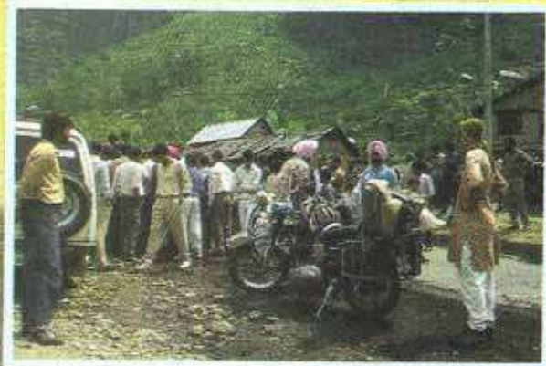
INDÉPENDANTISTES SIKHS DANS LE CACHEMIRE.