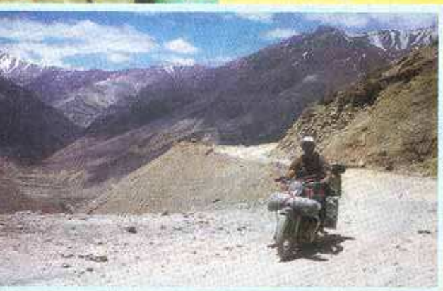
UNE ENFIELD DANS L'IMMENSITÉ DE L'UPSI.